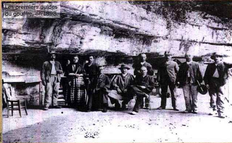
Les premiers guides du gouffre, en 1898.